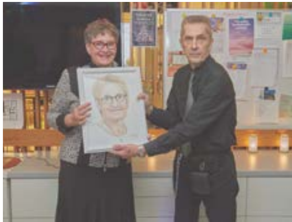
Klubitalon jäsenten ja henkilökunnan omissa iltajuhlissa 6. marraskuuta Monalle ojennettiin Jari J.:n piirtämä muotokuva

T oivon, että saamme jatkaa tätä tärkeää työtä myös tulevaisuudessa. Koen olevani etuoikeutettu saadessani olla mukana yhteisössä, jossa voimme kulkea jäsentemme rinnalla heidän elämänpolullaan – tukien, rohkaisten ja mahdollistaen sen, että yhä useampi löytää takaisin oman elämänsä ruorin ja uskaltaa tarttua siihen.