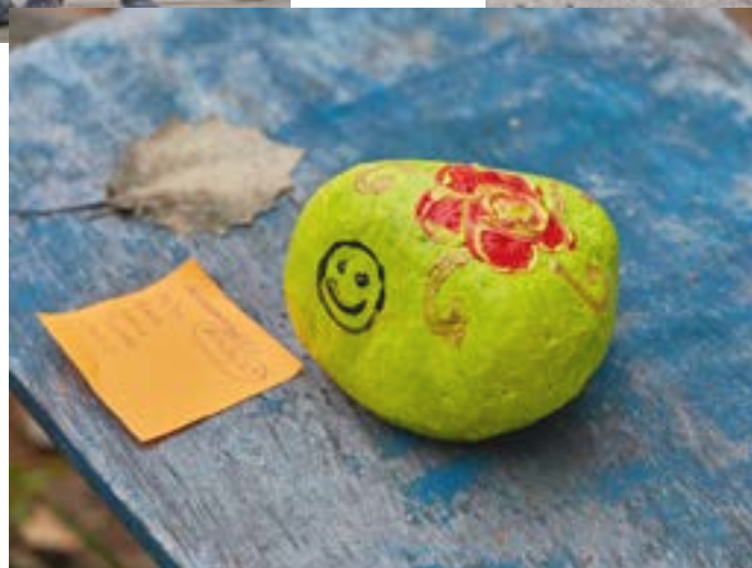
Kivien maalaus oli yksi rastitehtävä leikkimielisessä joukkuekisassa.