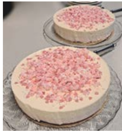
Teksti ja kuva: Pirjo

O piskelijoiden GSD-ryhmä (Get Stuff Done) on kokoontunut kvartaalin aikana yhdeksän kertaa, koko vuonna ryhmiä on ollut yhteensä 32 kertaa. Osallistuminen on ollut mahdollista talolla sekä teamsin välityksellä. Osallistujia on ollut kahdesta kolmeen.