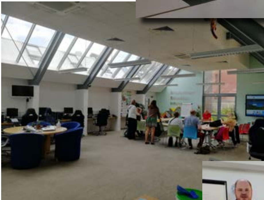
Yllä: Viimeinen koulutuspäivä. Employment, Education and Information - yksikössä valmistautumassa Action plan-esityksiin.