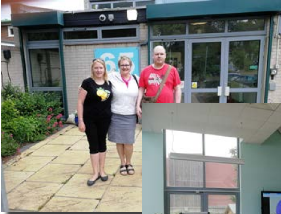
Perillä Lontoon Mosaic Klubitalolla. Jännittää!