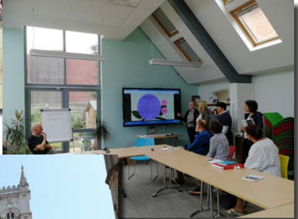
Yllä: Flourish House Skotlannista esittäytyy meidän esittelyn jälkeen.