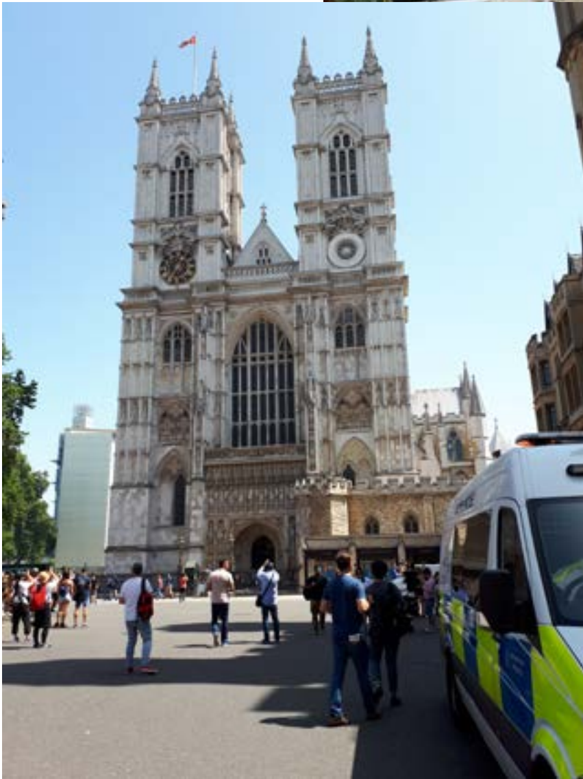
Vasemmalla: St. Paul'in katedraali. Siirtymätöpaikkavierailun jälkeen oli tilaisuus hieman myös nähtävyyksiin tutustumiseen.