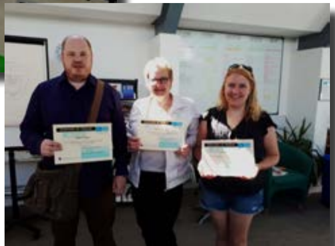
Oikealla: Onnelliset valmistuneet! Nyt uudet opit käytäntöön!