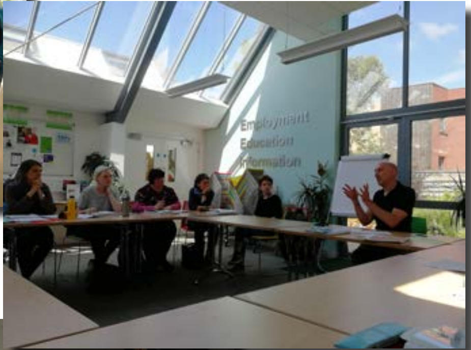
Alla: Iltapäivisin kävimme keskustelua Klubitalon perusteista.