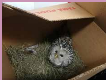
Sulo matkalla Korkeasaaresta takaisin Järvenpäähän.

Kannen kuvassa Sulo, meillä 29.10.2018 vierailut lehtopöllö.