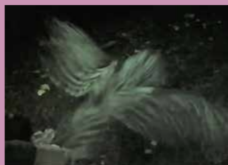
Sulo lähdössä takaisin luontoon.

Uutisia tapauksesta oli Keski-Uusimaassa, mtvuutiset.fi:ssä ja Iltalehden verkkosivuilla.