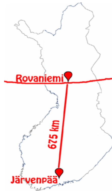
Teksti: Harri Piirros: Samuli Creative Commonsin karttapohjalla

”Saimme muilta Klubitaloilta hyviä ideoita”